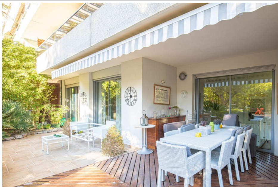
Appartement 20 Marseille